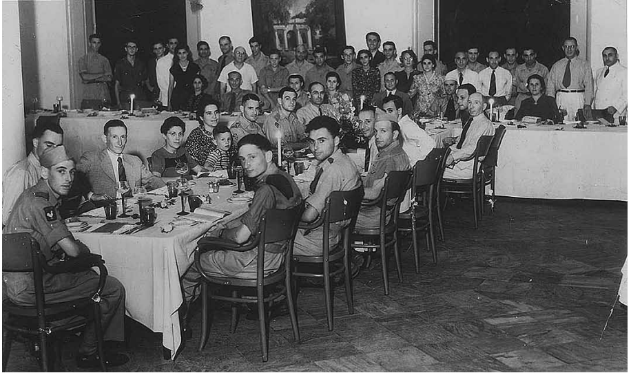
Seideravond met militairen te Batavia, 1948.

nam vrijwillig dienst, zoals staatloze Joden die op deze manier de Nederlandse nationaliteit hoopten te verkrijgen.