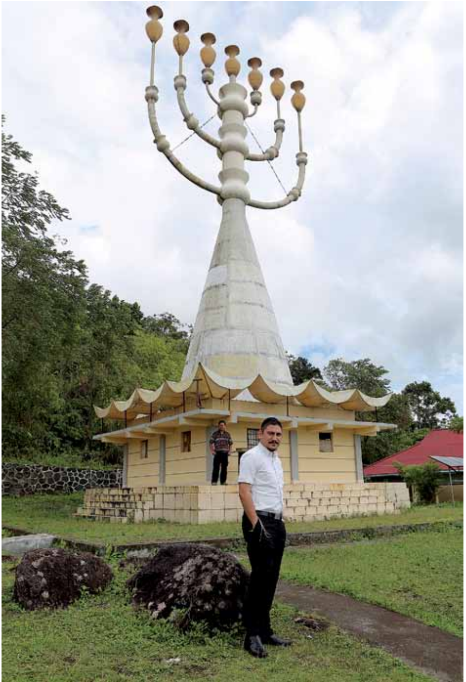
Boven op de heuvel bij Manado staat een negentien meter hoge zevenarmige kandelaar (menora). Niet ver daarvandaan staat een metershoog Christusbeeld.